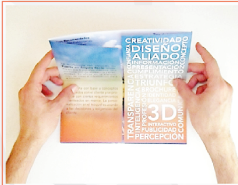
BROCHURE IMPRESO 46X23,5 cms PUERTA EN ÁNGULO RECTO BR-IMP-010

La morfología del plegado de Puerta en Ángulo Recto muestra en sus 6 paneles clásicos, una connotación de elegancia y practicidad. Es eficaz en la transmisión de ideas e información clara y concisa.