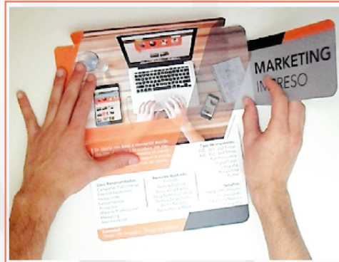
BROCHURE IMPRESO SOBRE CON CUPÓN PUBLICITARIO 22x14 cms BR-IMP-007

Su cupón incorporado es de fácil acceso y retirada con eficacia, pues cumple con un perforado de alta calidad. Se diseña con base a conceptos acordados con el cliente y se produce con requerimientos planteados en mente. La personalización en el troquel es acorde a las decisiones y exigencias del cliente.