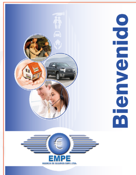
BROCHURE DIGITAL EMPE AGENCIA DE SEGUROS 14 PÁGINAS PDF VERTICAL