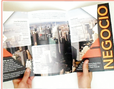
BROCHURE IMPRESO 58x28 cms CARPETA DE BOLSILLO BR-IMP-004 DE TRES PLIEGUES

Una vez abierto el formato completamente, se exhibe tres pliegues de manera horizontal, dando lugar a infinitas opciones para componer un buen diseño.