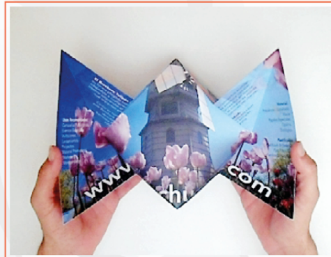
BROCHURE IMPRESO TULIPÁN

Como su nombre lo indica, este Brochure se abre y cierra denotando una hermosa flor llamada tulipán.