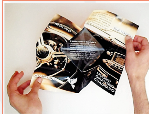
BROCHURE IMPRESO MOLINO GIRATORIO CUADRADO 31x31 cms BR-IMP-017

Sigue siendo un diseño hermoso en su función, y único en sus plegados diagonales.