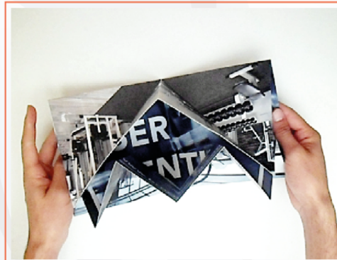
BROCHURE IMPRESO OSTRÁ 36x54 cms BR-IMP-020

El Brochure Ostra refleja la creatividad impactante con su diseño en formato grande. Es esencial para presentaciones que connoten excelencia distintiva. Lleva incorporado tres insertos especiales para el reflejo de la información adicional. Es funcional y altamente llamativo en cualquier ámbito en el que se desee conceptualizar.