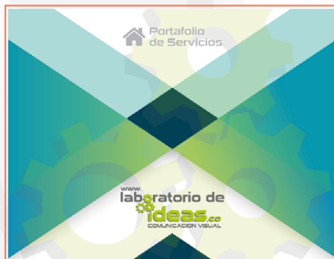
BROCHURE DIGITAL LABORATORIO DE IDEAS 9 PÁGINAS PDF HORIZONTAL