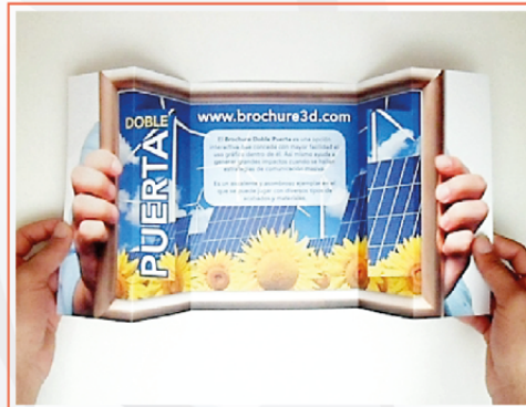
BROCHURE IMPRESO DOBLE PUERTA 47x21 cms BR-IMP-023

Excelente y asombroso ejemplar en el que se puede jugar con diversos tipos de acabados y materiales.