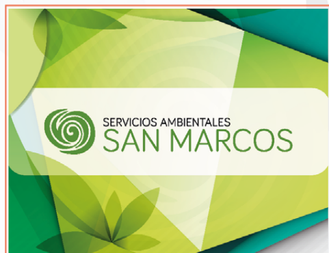
BROCHURE DIGITAL SERVICIOS AMBIENTALES S.M. 17 PÁGINAS PDF HORIZONTAL